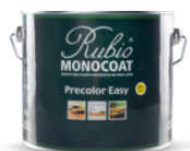
Blik 2,5 L