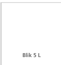
Blik 5 L