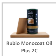
Rubio Monocoat Oil Plus 2C